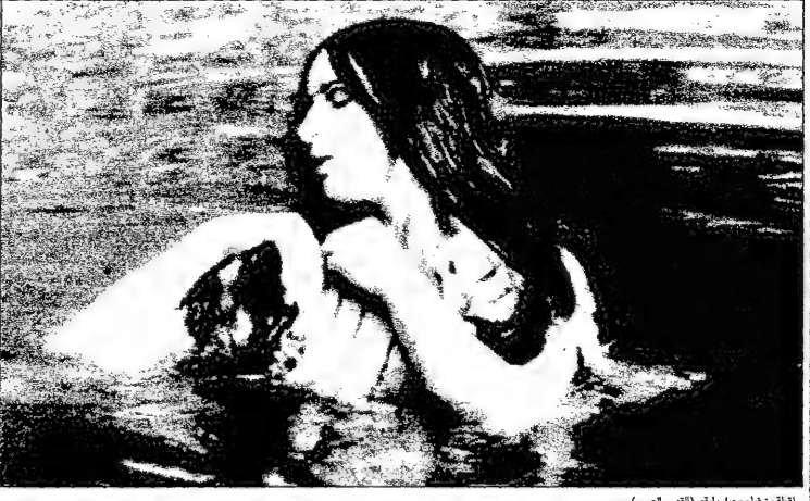
لغة من فيلم جيل بياض (القلم العربي)

لغة من فيلم جيل بياض (القلم العربي) لغة من فيلم جيل بياض (القلم العربي) لغة من فيلم جيل بياض (القلم العربي)